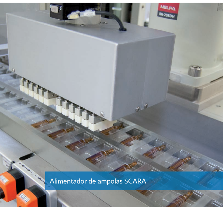
Alimentador de ampolas SCARA