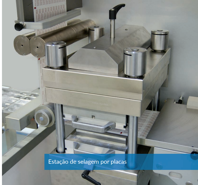
Estação de selagem por placas