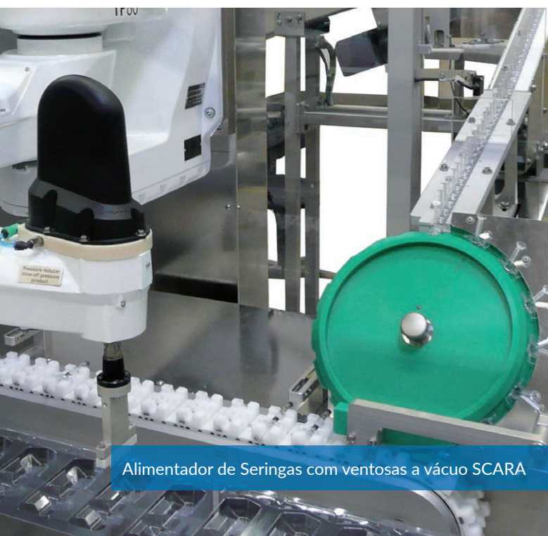
Alimentador de Seringas com ventosas a vácuo SCARA