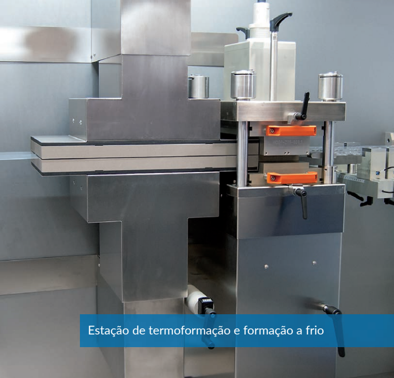
Estação de termoformação e formação a frio